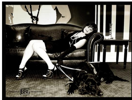
Photographie Eva Moreno pour I SEE YOU.