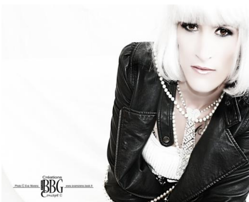
Photographies Eva Moreno pour I SEE YOU. Les Corps Singuliers – 2010.